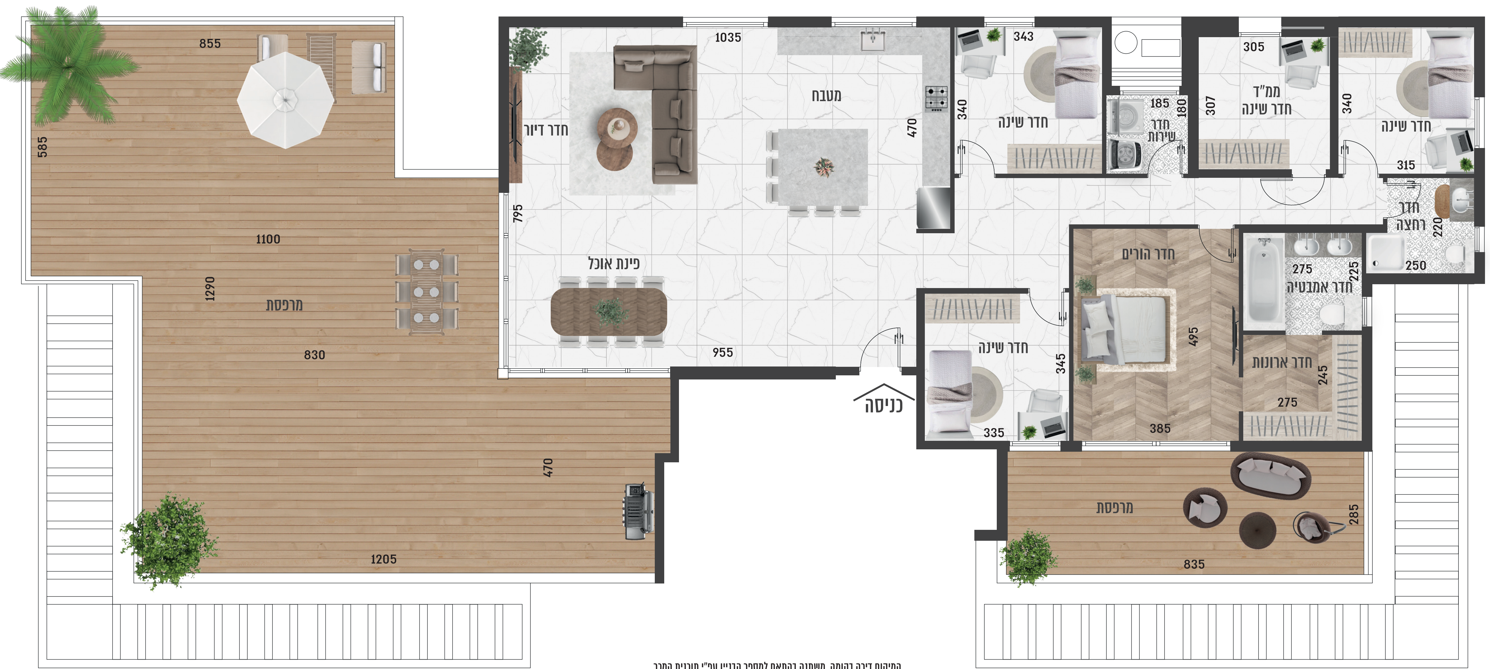
המיקום דירה בקומה משתנה בהתאם למספר הבניין עפ"י תוכנית המכר